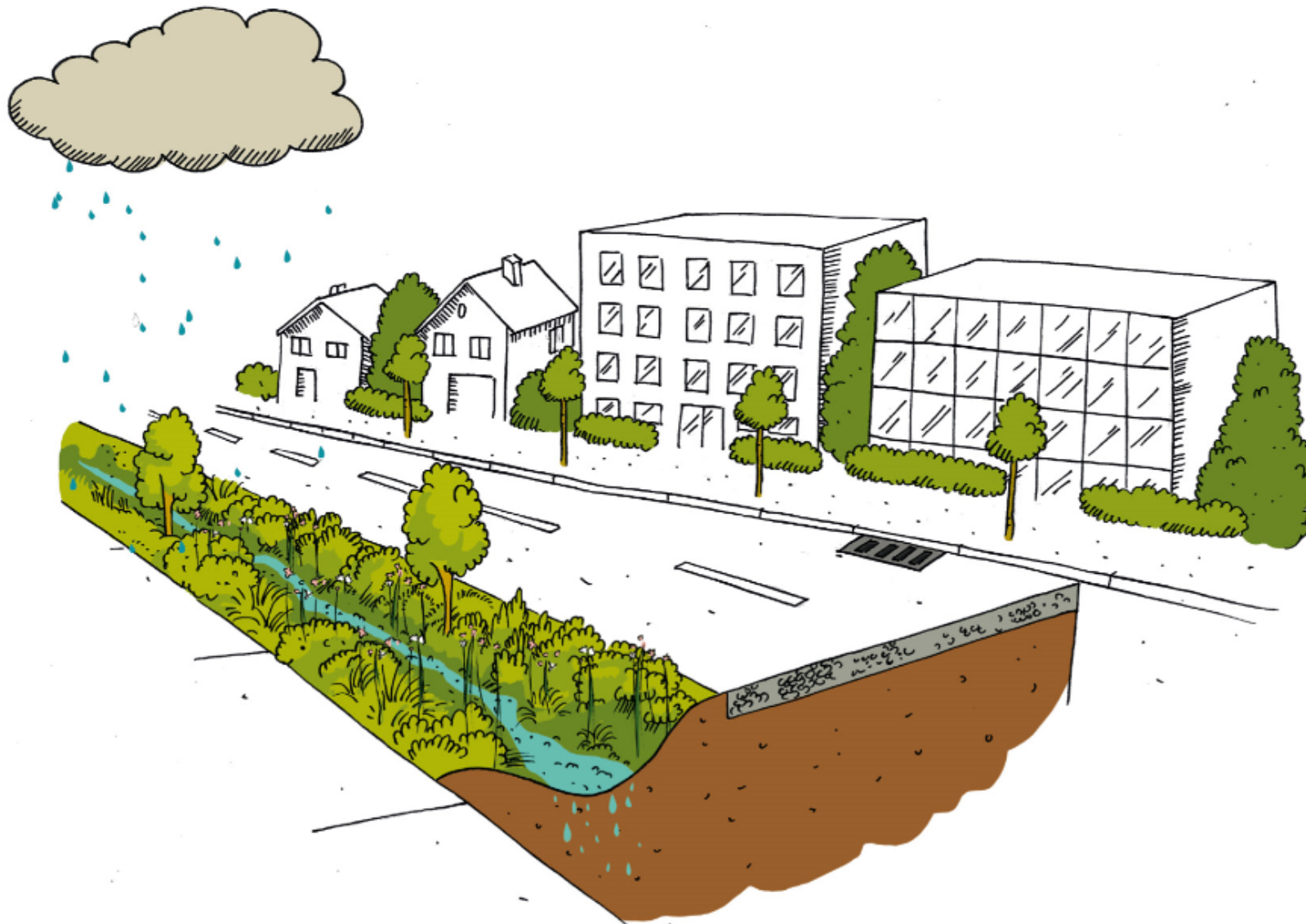
Illustration du GRAIE