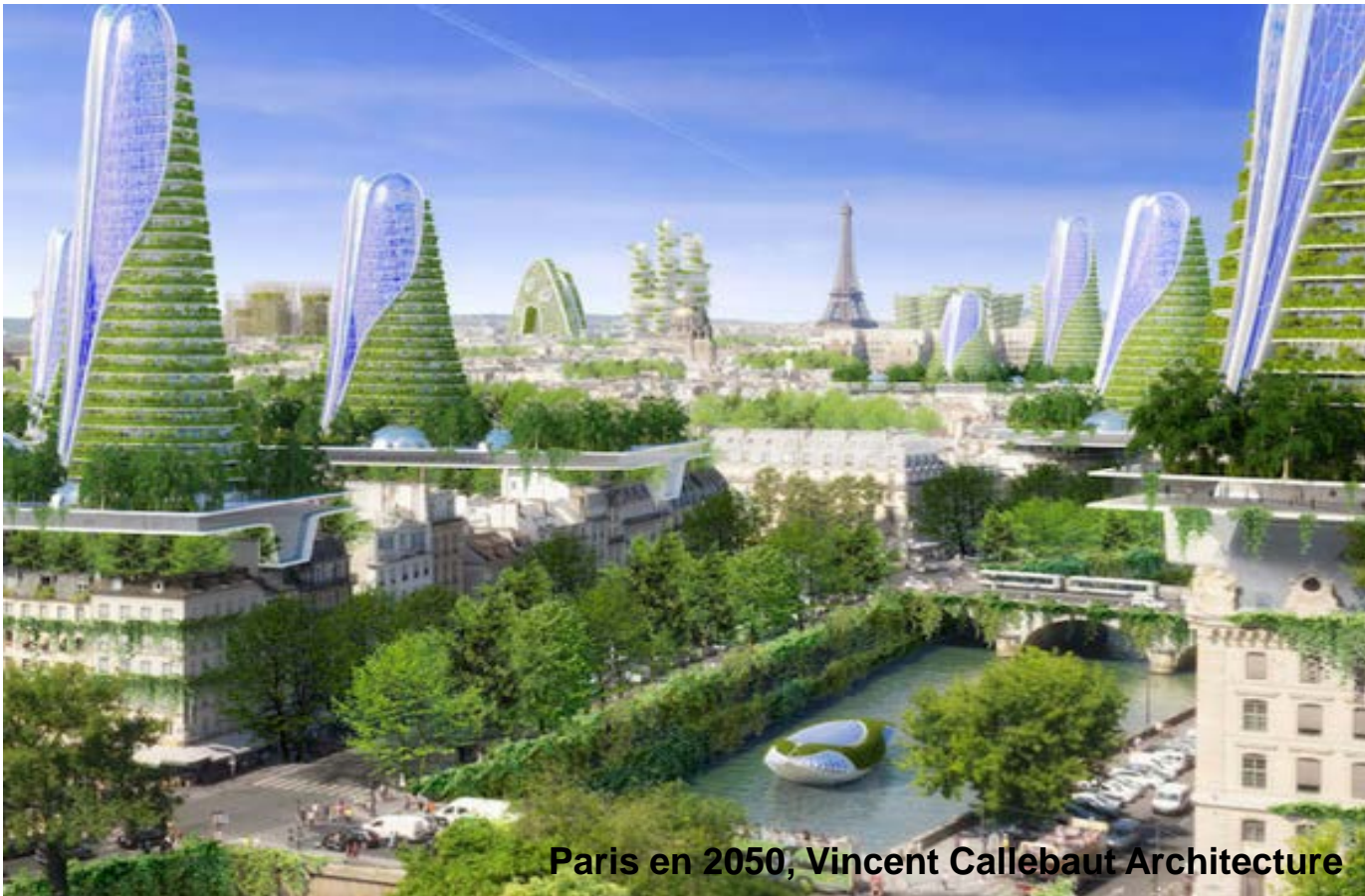
Paris en 2050, Vincent Callebaut Architecture